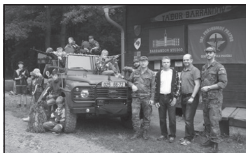
Copak je to za vojáka? No přeci kamarádi ze 102. průzkumného praporu z Prostějova