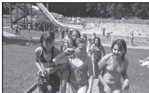
Koupaliště ve Skutči – oblíbený cíl celodenních výletů