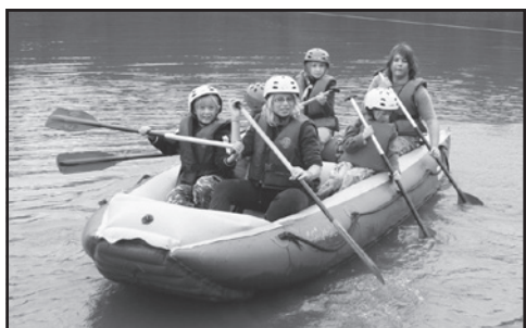
Závod raftáků rozproudí krev v žilách celému táboru