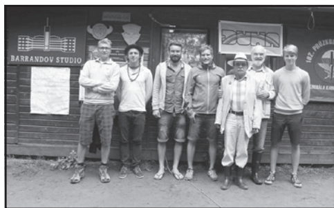
Světová předpremiéra Třech bratrů na táboře 2014 J. a Z. Svěrákovi, J. Uhlíř, T. Klus, Z. Piškula