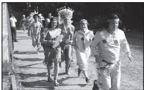
Celý tábor protíná jako zlatá nit celotáborová etapová hra