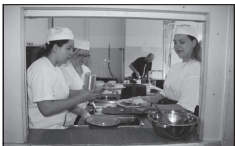
Čerstvé chutné jídlo připravujeme pětkrát denně