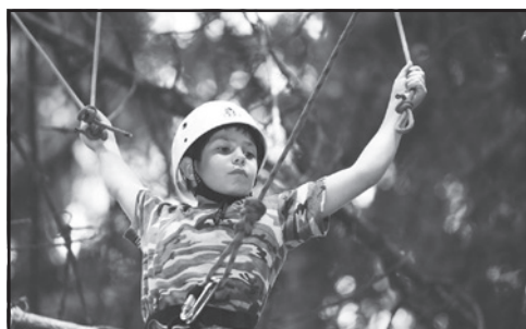
Lanové centrum v korunách stromů