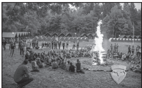
Na táboře nesmí chybět slavnostní oheň se zpíváním a kytarami